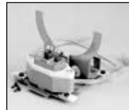
L4.71369.E Lamp holder + lamp carriage compl. Lampenfassung + Fassungsträger kpl.