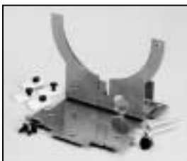
L4.71366.E Lamp carriage Fassungsträger