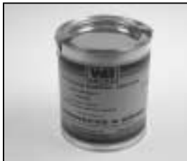
L4.70194.E Paint blue similar RAL 5015 Lack blau ähnlich RAL 5015