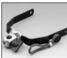
L4.79110.E Stirrup complete Haltebügel komplett