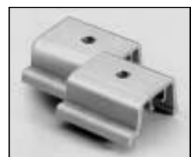
L4.79420.E Stirrup bracket Bügelhalter