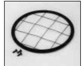
L4.79168.E Wire guard Schutzgitter