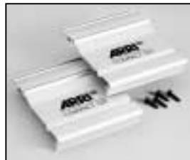
L4.71359.E Set of side panels Set Seitenbleche