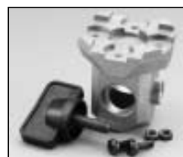
L4.77145.E 16 mm stirrup socket Hülse für Bügel