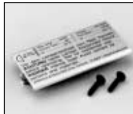
L4.71364.E Bottom plate Bodenblech