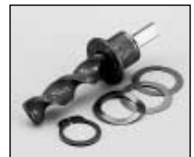
L4.77889.E Focus spindle Fokusspindel