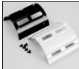
L4.71361.E Top cover compl. Deckel kpl.