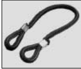
L4.79855.E Cable tie Halteleine