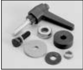
L4.77174.E Stirrup mounting set Bügelbefestigungs-Set