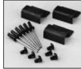
L4.79240.E Set of accessory brackets Set Torhalter