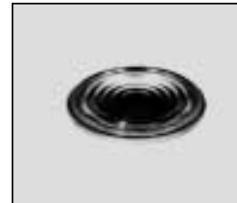
L4.79207.E Fresnel lens Stufenlinse