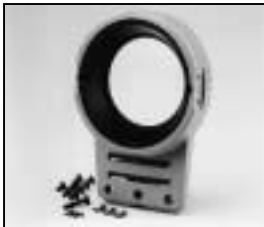
L4.71365.E Front casting Frontteil

NOTE: WHEN ORDERING QUOTE PART NUMBER BEMERKUNG: BEI BESTELLUNG IDENT.-NR. ANGEBEN