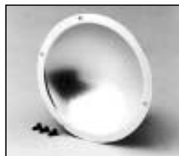
L4.79237.E Reflector Reflektor