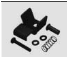
L4.79244.E Top latch Verschlussklaue