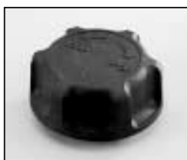
L4.79036.E Focus knob Fokusknopf