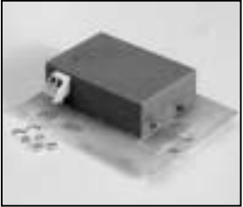
L4.71356.E Ignitor Zündgerät