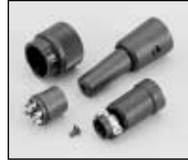
L4.73369.E Connector (Female) Stecker (Buchsenkontakt)