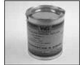
L4.70183.E Paint black similar RAL 9011 Lack schwarz ähnlich RAL 9011