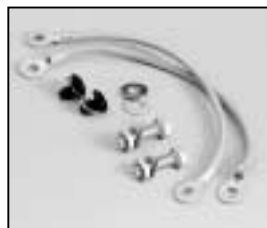
L4.71370.E Connecting wire Verbindungsleitungen