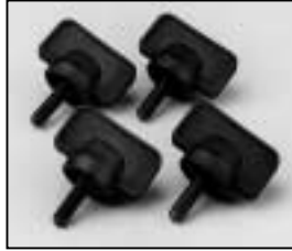
L4.79436.E Set of locking knobs Satz Arretierschrauben