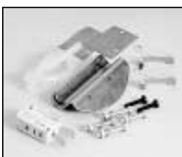
L4.71355.E Safety switch compl. Endschalter kpl.