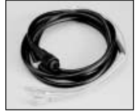
L4.71363.E Mains cable Scheinwerferkabel