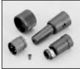
L4.73367.E Connector (Male) Stecker (Stiftkontakt)