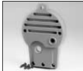
L4.71354.E Rear casting Rückteil