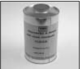
L4.70186.E Paint thinner Farb-Verdünnung