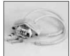
L4.71360.E Lamp holder Lampenfassung